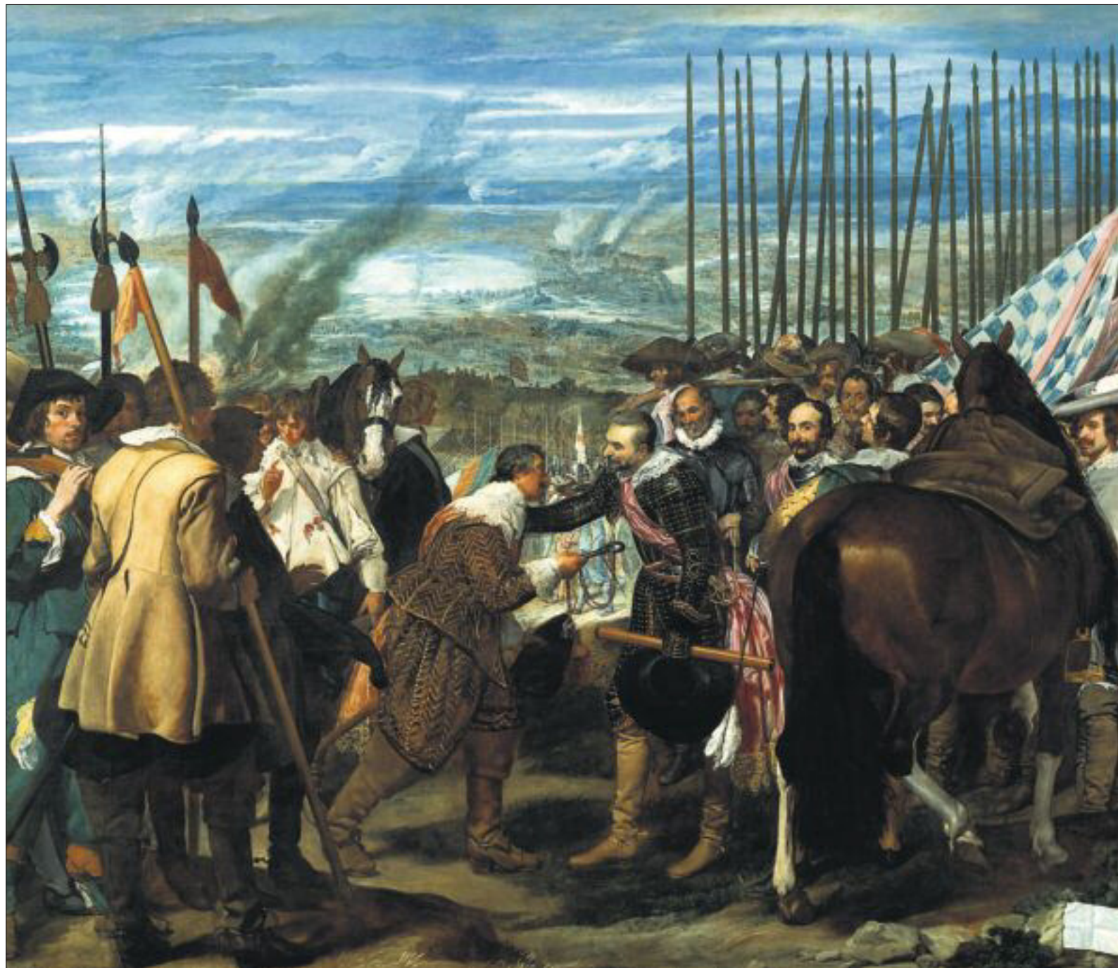
La rendición de Breda, de Velázquez, reproduce un episodio clave en la larga guerra para impedir la independencia de los Países Bajos

acentuó un intenso proceso de redistribución del ingreso en contra de la mayoría de los castellanos. Cuando las cosechas cayeron abruptamente en las décadas de 1580 y 1590, descenso propiciado por un cambio climático desfavorable que se sintió en toda Europa, las vías hacia la recesión y la contracción demográfica quedaron expeditas.