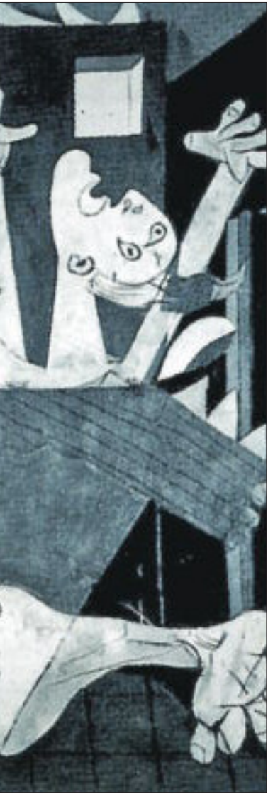
El Guernica de Picasso retrata uno de los peores episodios de la Guerra Civil.

de la inversión privada, originado por el empeoramiento de las expectativas empresariales, tras el establecimiento de la República, por los conflictos sociales, las políticas socializantes, el acoso a la propiedad por los Gobiernos, la desconfianza en el régimen y la paralización de las obras públicas. El hundimiento de la inversión privada fue clave en la depresión coyuntural de la economía española, pero la explicación de Olariaga requiere algunas matizaciones.