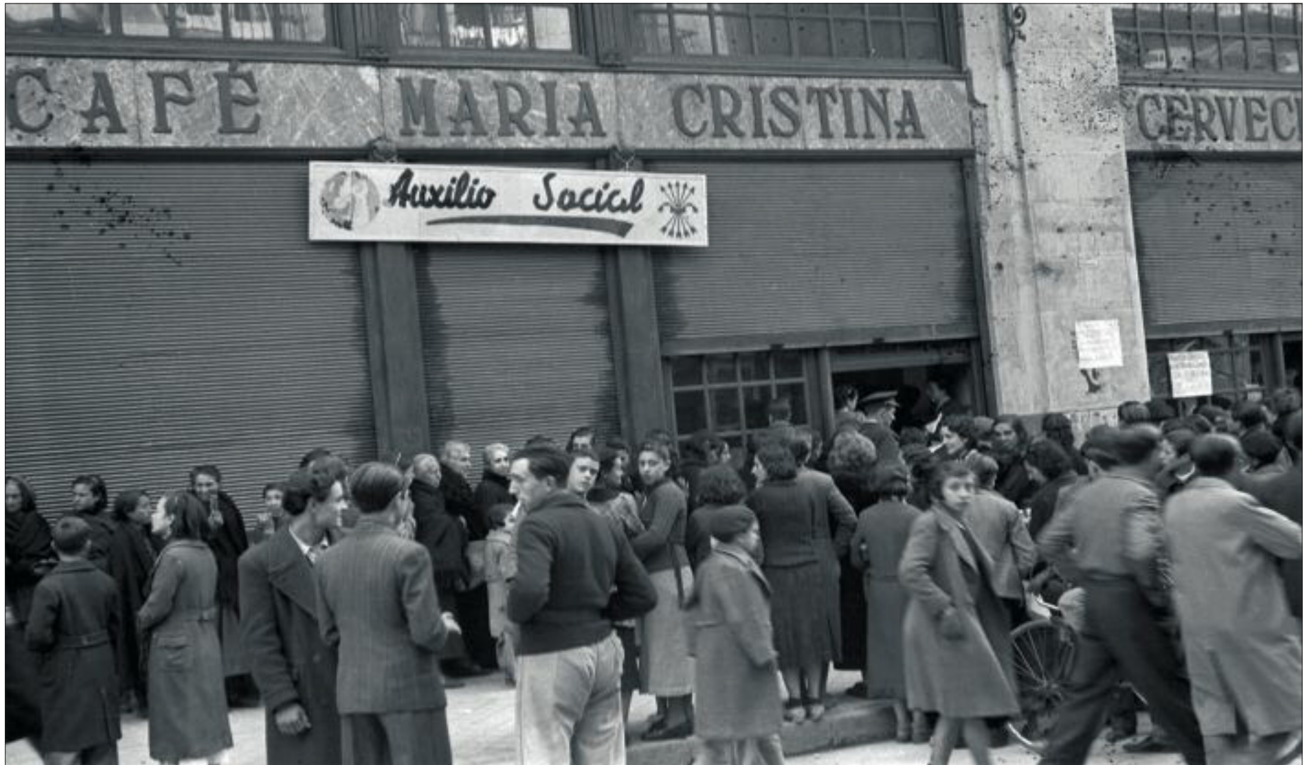
Ciudadanos de Madrid hacen cola ante un almacén del Auxilio Social, un organismo creado por el régimen de Franco para ayudar a la población más necesitada.