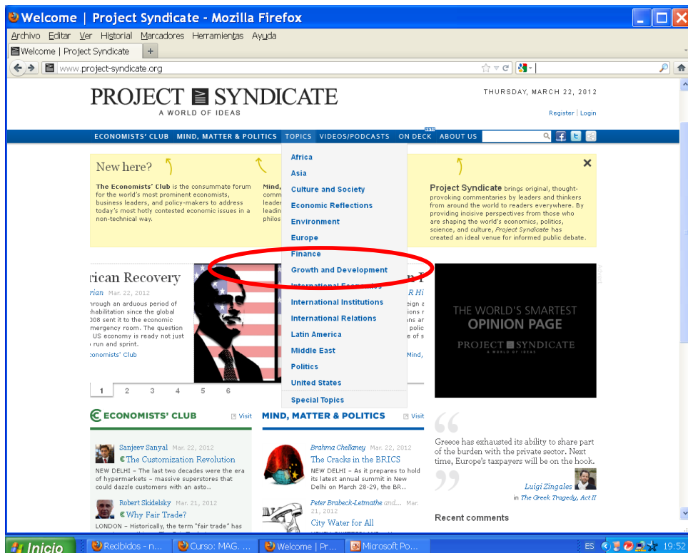
Imagen 1.2: Blog Project Syndicate, temas relevantes