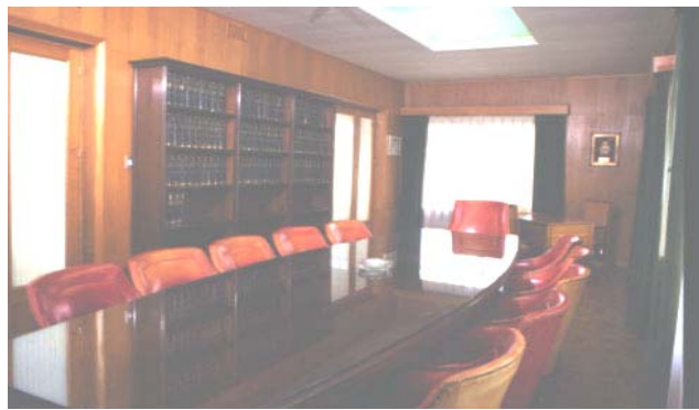
Sala de investigadores del Archivo