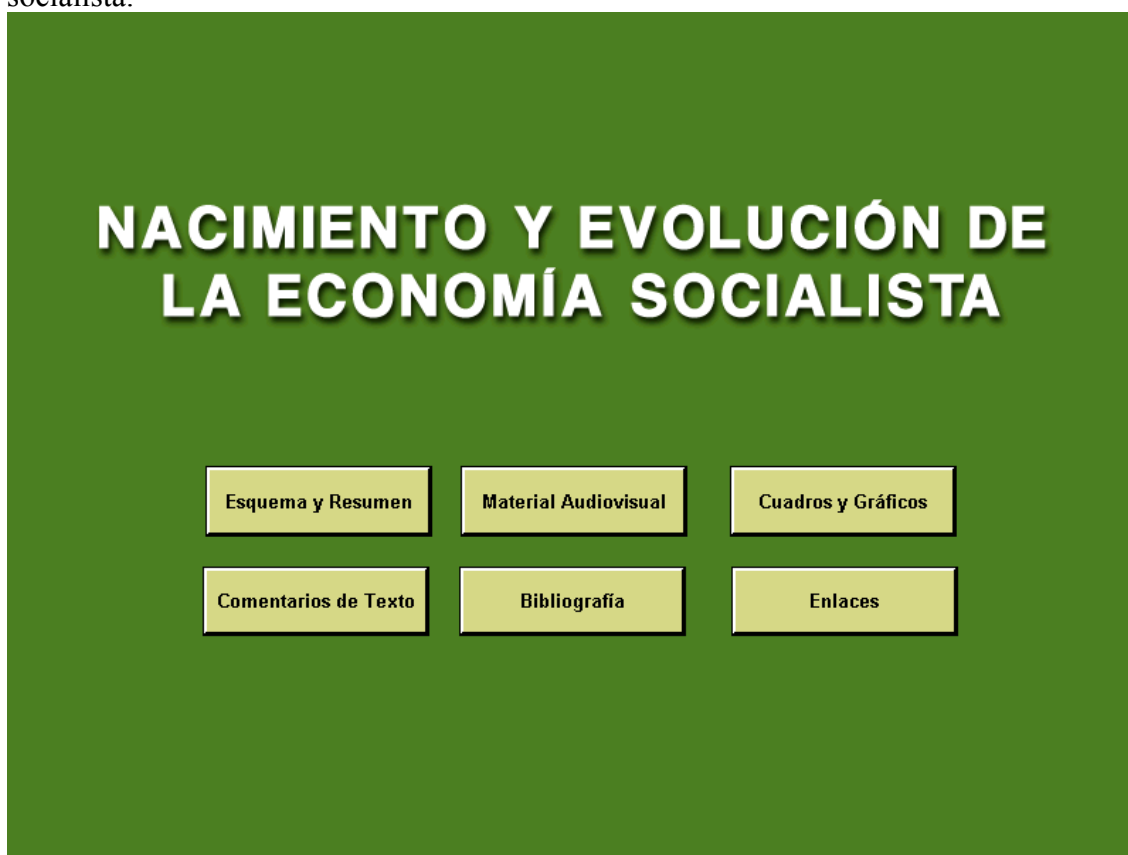
Ilustración 1. Pantalla de inicio del tema “Nacimiento y evolución de la Economía socialista.

Una vez ejecutado el programa de la guía (ilustración 1), que se entregará en CD o DVD pero que también podría utilizarse en remoto mediante acceso “on line” a través de Internet, se ofrece al alumno, de manera sobria, sin alardes visuales (cosa que consideramos importante) las opciones que pueden ir visitando.